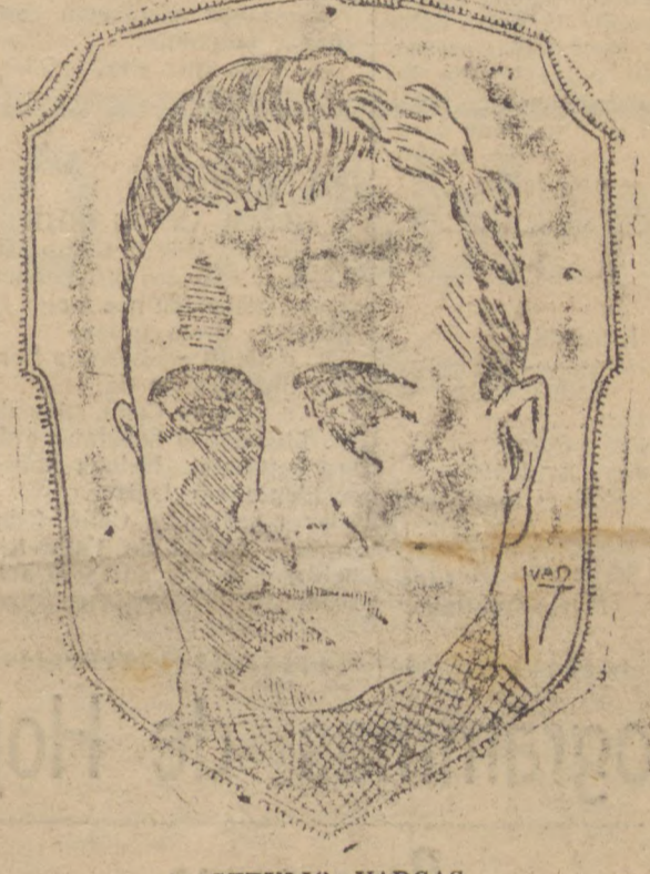
GETULIO VARGAS reerguer o nome do Brasil junto aos demais países do mundo. Assim sendo, deve a nação, hoje, sentir-se ufana por uma data que é, afinal, uma data de todos nós.

Getulio Vargas se tem conduzido com intelligencia e fidalguia, conseguindo