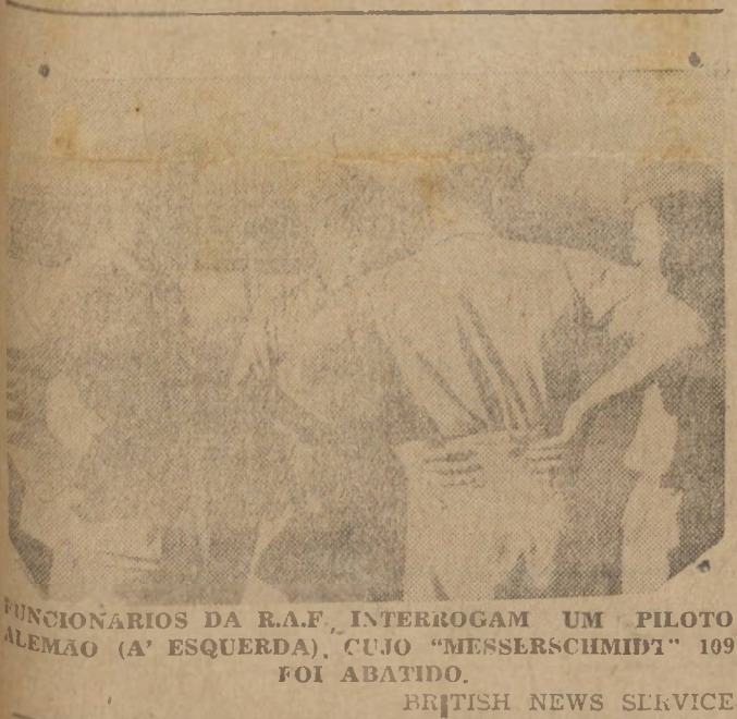
FUNCIÓNARIOS DA R.A.F. INTERROGAM UM PILOTO ALEMÃO (A' ESQUERDA), CUJO "MESSERSCHMIDT" 109 FOI ABATIDO.