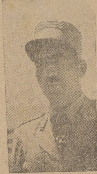
GENERAL DE GAULLE

de Gaulle para aceitar e anunciar a renúncia de Peyrouton.