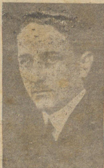
Sr. Marcondes Filho

RIO, 1 (DB) — O senador Marcondes Filho declarou à imprensa que não fez nenhuma declaração de caráter político, salvo para esclarecer que está completamente alheio à reestruturação do PTB de São Paulo, pois condicionou suas atividades partidárias à modificação do Diretorio Central, que não se realizou.