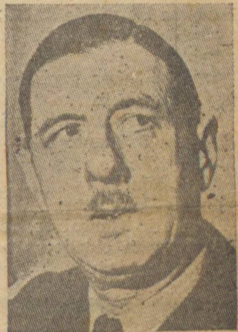
GAL. DE GAULLE