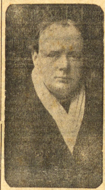
Sr. Winston Churchill, 1º Lord do Almirantado britânico

LONDRES, 17 (S. P., agência inglesa) — O 1º Lord do Almirantado, sr. Winston Churchill, no proximo sábado deverá pronunciar um importante discurso, que está sendo aguardado com o mais vivo interesse.