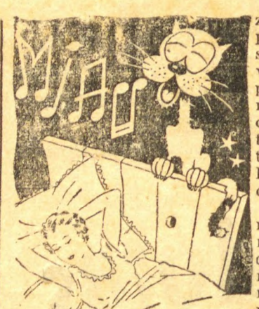
— agora não chora gatinha! — Pois o meu gato fugiu com a gata da vizinha!