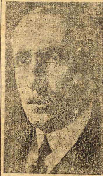
ao movimento revolucionario de São Paulo.

Com essa critica em termos energicos e decididos dos jornaes, o manifesto do dr. Arthur Bernardes é assumptivo obrigatorio de todas as conversações.