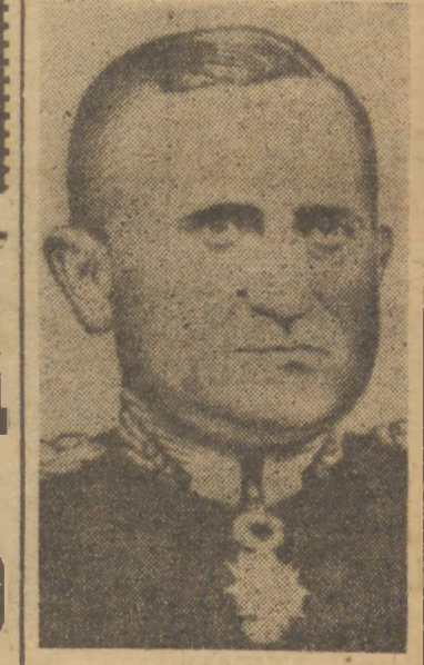
GENERAL EURICO GASPARDUTRA, Ministro da Guerra

RIO, 8 (A. N.) — A 9 de dezembro de 1936, assumiu as elevadas funções de Ministro da Guerra, o General