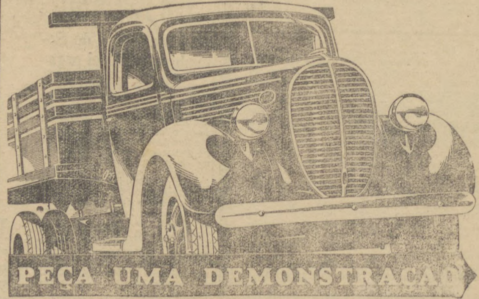
PEÇA UMA DEMONSTRAÇÃO

Ford espera-os com o NOVO CAMINHÃO DE 95 CAVALOS