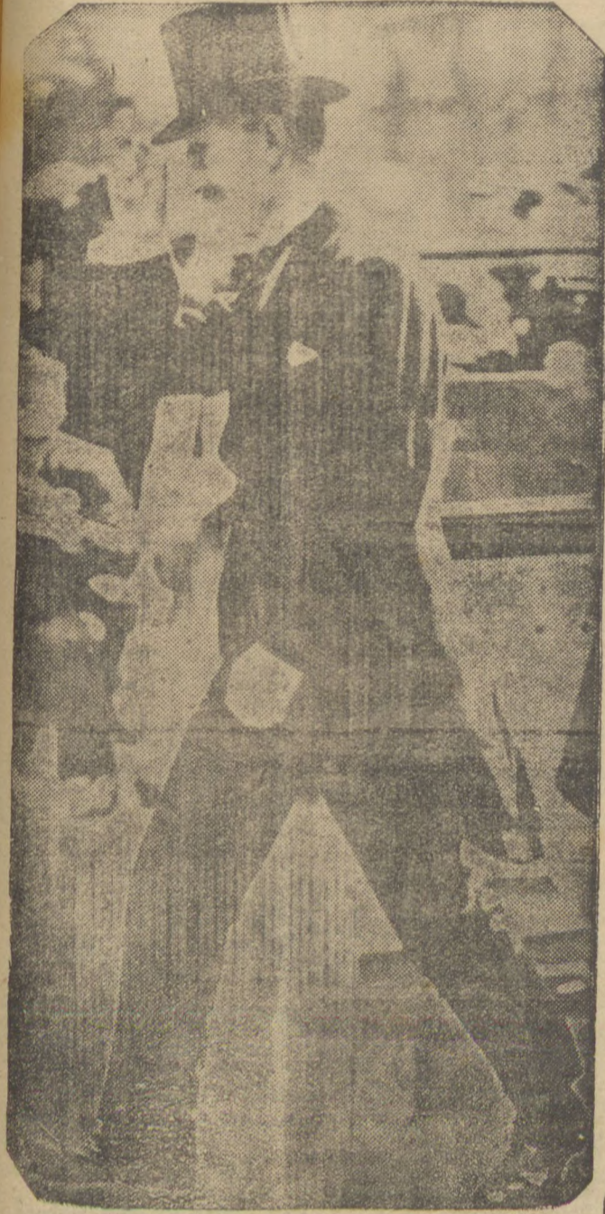
O SR. CHAMBERLAIN A ENTRADA DO PARLAMENTO

O Sr. Mussolini Entrou Com Um Projeto De Acordo Pacifico — Hoje, Ao Meio-Dia, Será Tomada Em Londres a Decisão Final