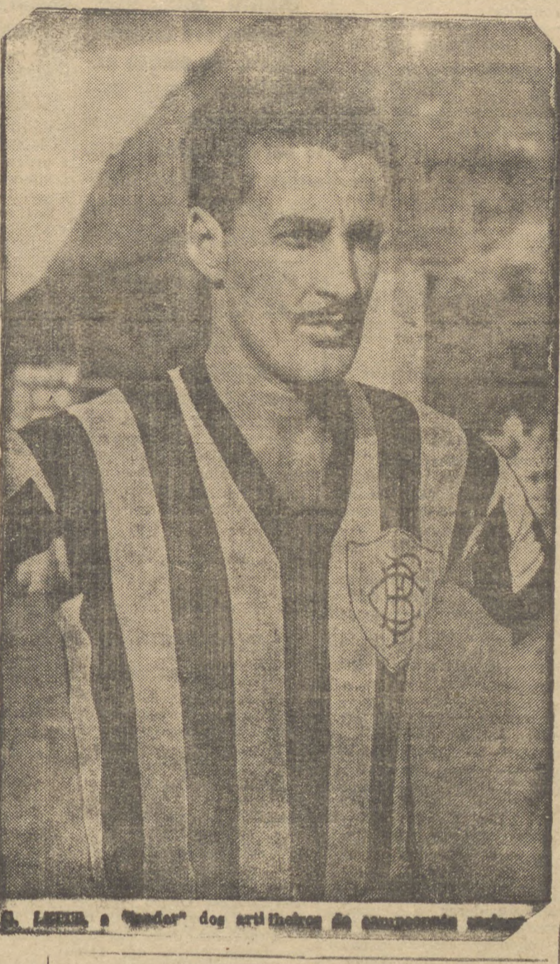
A. LIMA, o "torcedor" dos artilheiros do campeonato...