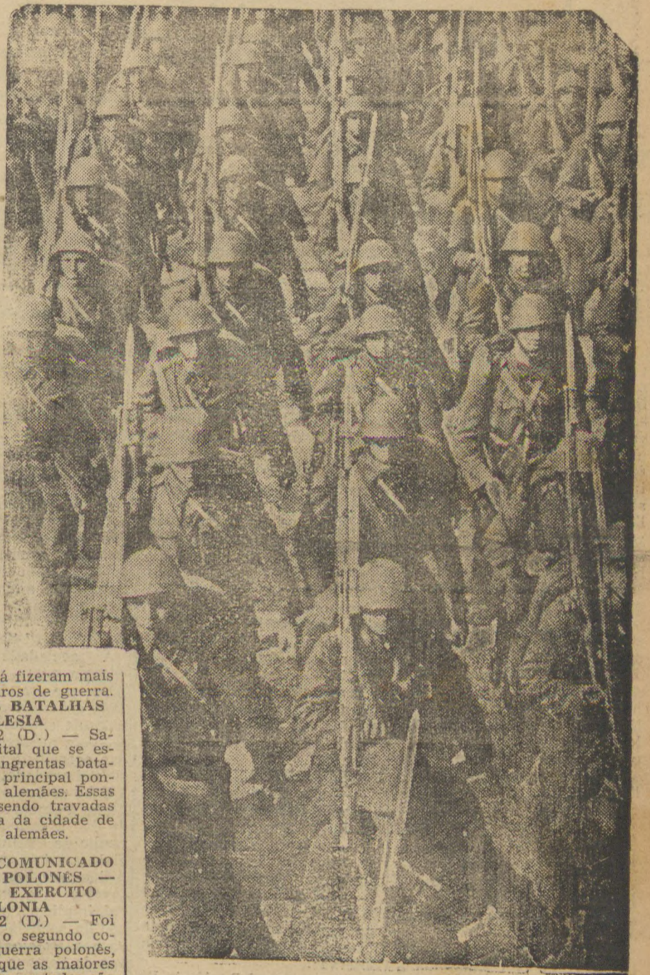
Soldados poloneses em marcha. — (Ler noticiario na 4ª pag.)

NOVA YORK, 2 (D.) — Nos jogos para a disputa final da Taça Davis, os Estados Unidos venceram a Australia, nas duas "singles", ganhando assim dois ótimos pontos para a finalista.