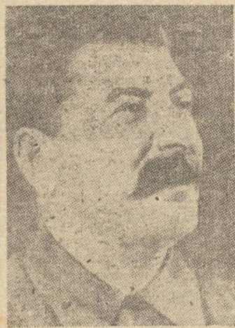
STALIN, QUE ESTARIA IMBUÍDO DOS MELHORES PROPÓSITOS DE PAZ

LONDRES, 23 (U. P.) — Anuncia-se, de fontes ligadas aos circuitos oficiais, que o governo polonês de Londres vai desaparecer, visto como o Inglaterra retirar-lhe-a o apoio que lhe vinha dando, passando a reconhecer o governo polonês que resultou da conferência de Moscou.