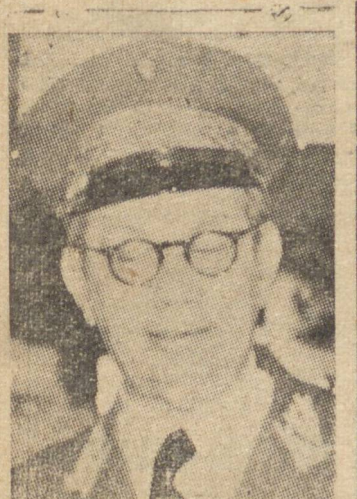
GENERAL GÓES MONTEIRO

a pasta da Guerra, adiantando que apenas houve cogitações nesse sentido, podemos afirmar hoje que o general Góes foi realmente convidado para substituir o general Caspar Dutra, tendo aceitado o convite.”