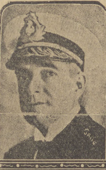
Almte. Protógenes Guimarães

27 (D) — Continuando a ordem do dia o bombardeamento do navio mercante brasileiro "Paraguay", sabado ultimo, no rio Paraguay, por dois aviões bolivianos. O atentado deu-se quando o navio "Paraguay", que pertence ao Lloyd Brasileiro, navegava á altura de Ladario. Felizmente, nenhum dos projecteis alcançou o navio. Essa embarcação brasileira tem como seu comandante o capitão de mar e guerra Paul Guimarães.