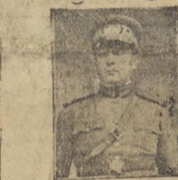
General Flores da Cunha

"Quanto á eleição do presidente, o partido quer que o candidato seja Flores da Cunha, e elle o será, indubitavelmente.