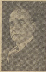
Sr. Getulio Vargas

PORTO ALEGRE, 27 (D) Telegrammas procedentes de