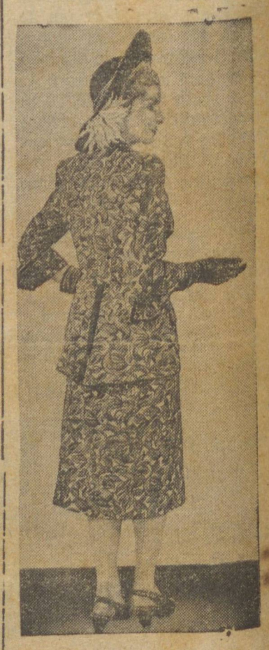
Este modelo apresentado por um famoso desenhista de modas inglesas é em estampado vermelho, branco e preto, combinado com o chapéu que chamam de «convivido de honra».