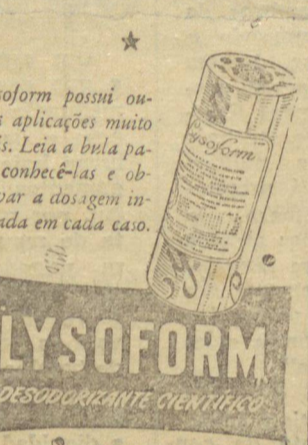
Lysoform possui outras aplicações muito úteis. Leia a bula para conhecê-las e observar a dosagem indicada em cada caso.