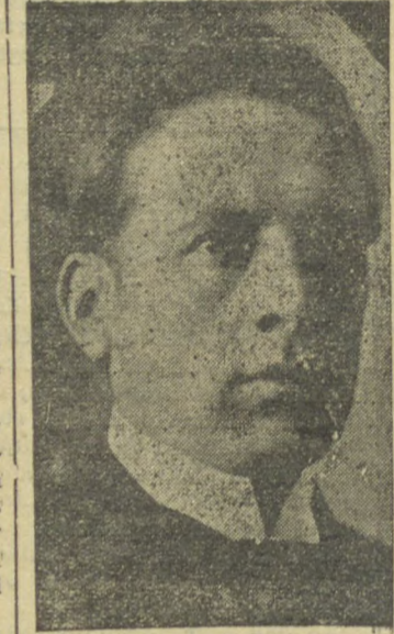
General Flores da Cunha