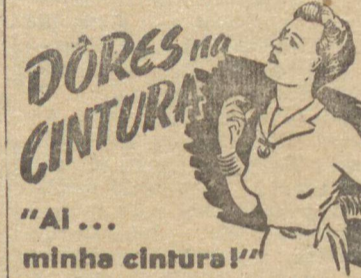
"Al... minha cintura!"

O comandante Waller, expressou-me sua grande gratidão e sua profunda admiração pela excepcional atitude de seus oficiais e marinheiros. O comandante Waller, salientou que o capitão de corveta