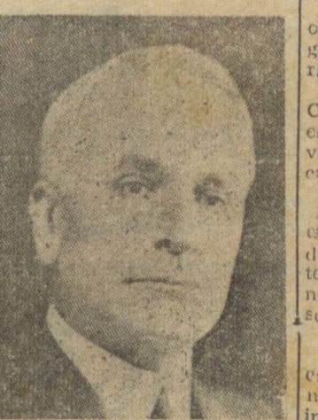
SR. CORDELL HULL

Prometeu finalmente, que nessa ocasião, todas as perguntas que lhe foram feitas pelos jornalistas e que ficaram em respostas serão plenamente esclarecidas.