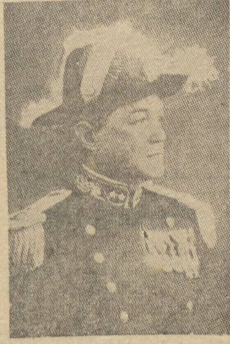
Almirante Aristides Guilhem

va a posição em que navegava o barco aliado em perigo. O comandante do "Maranhão", o capitão de corveta Mário Pinto de Oliveira, fez rumar imediatamente seu navio para o local a toda a força das máquinas. Ao chegar já o "African Star", havia sido atingido por um torpedo e se sobrava. Toda a tripulação todavia foi salva e recolhida pelo navio de guerra