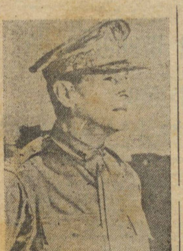
GENERAL MAC ARTHUR

SERA' LANÇADA A CANDIDATURA DE MAC ARTHUR PARA A PRESIDENCIA DOS ESTADOS UNIDOS