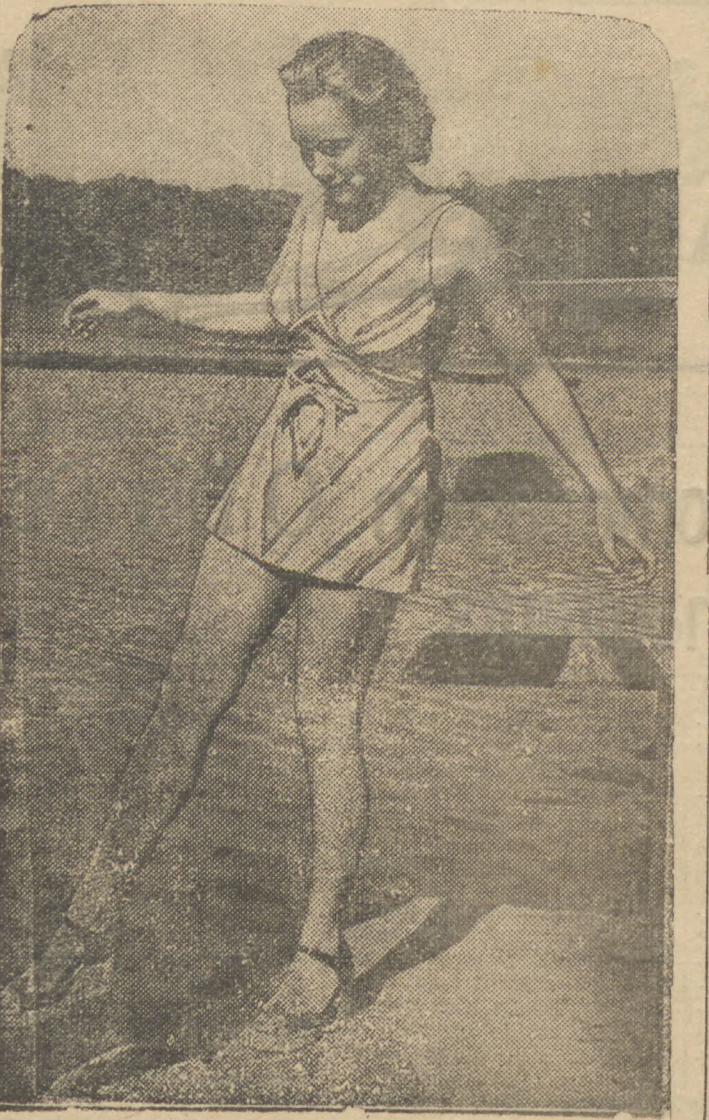
Um conjunto de praia em alegre tela de algodão rajado. A tela é sanphorizada, e de muita duração.

Tende amor á vida? Então não desperdiceis vosso tempo, pois elle é o proprio estofo de que a vida é feita.