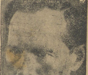
O presidente Smetona teve, finalmente, de capitular. E' que diante do direito da força, (essa é verdade velha), não pode resistir a força do direito...

No momento, o numero de deputados nazistas é de 70, num total de 72.