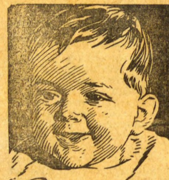
Esta pequena joia

De Schwiderski, Pilatti & Cia. RELAÇÃO DE CARROS USADOS A VENDA