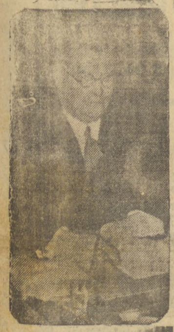
Erkko, ministro dos Negocios Estrangeiros da Finlândia

Rechassados os ataques moscovitas — Vinte e seis «tanques» destruidos. — Revoltou-se um batalhão de tropas soviéticas