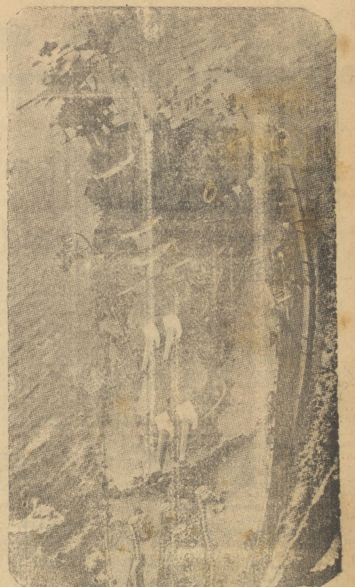
O encouraçado «de bolso» aie mão «Admiral Graf Spee», que era o orgulho da ma rinha de guerra do Reich

se a anunciar que o Departamento de Estado estava conserenciando com as outras vinte nações americanas afim de estabelecer uma maneira de agir no futuro si um navio de guerra de uma nação beligerante penetrar em porto americano. As negociações ainda não haviam chegado a um ponto em que seria permitido fazer qualquer declaração a esse respeito. Entretanto, dentro desta semana era provavel que isso se daria. MONTEVIDEO, 18 (T. O., agência alemã) — «La Tribuna Popular», que se publica nesta cidade, pede seja esclarecida a atitude do governo uruguaio para com o navio de guerra alemão «Admiral Graf Spee». «O povo, assim escreve o jornal, pede esclarecimentos completos em vista do protesto da Alemanha que deixa o governo no em situação melindrosa. Os matutinos que publicaram em