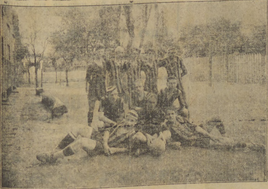
O homogêneo onze do Novo Ateneu

Deverá chegar hoje a esta cidade, pelo expresso curitybano a Caravana dos ginastas do Novo Ateneu, da capital. A Caravana que tem visita de cordialidade a classe estudantina local, demorar-se-a alguns dias, levando a efeito diversos jogos esportivos, que obedecem o seguinte programma