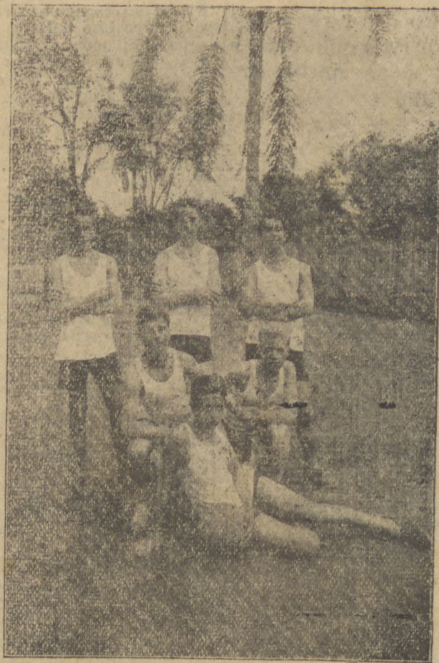
O valente time do Novo-Ateneu

Na principal, durante os 20 minutos iniciais, o