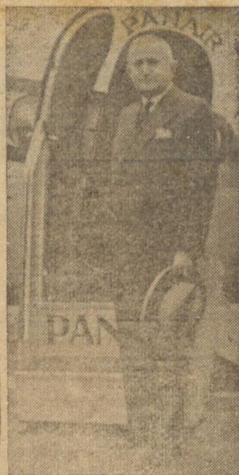
GENERAL EURICO GASPAR DUTRA

Quando os eleitores votaram foi com a previsão de que es-