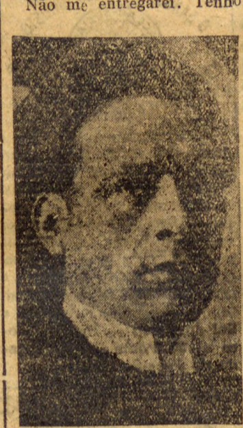
O gal. Flores da Cunha, que está no firme proposito de manter a ordem ou morrer

honra do Rio Grande, no momento em que sou victima da opposição que pretende nos apunhalar pelas costas, num movimento nitidamente reacionario. Não me entregarei. Tenho