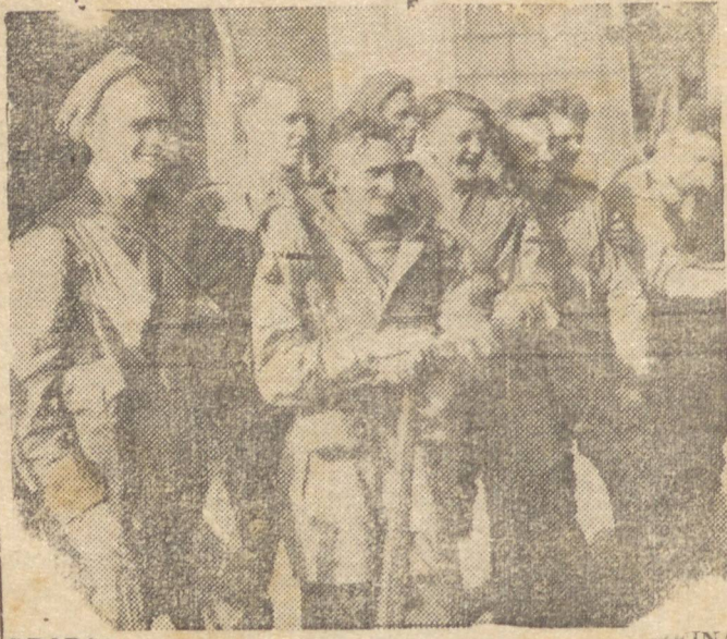
TROPAS BRITANICAS A importância das tropas de paraquedistas na guerra moderna é reconhecida pelo Exército Britânico, e as tropas transportadas pelos ares foram empregadas nos últimos 4 dias de assaltos simulados.

Relojoaria, Joalheria e artigos para presentes. Rua 15 de Novembro, 20 — Ponta Grossa