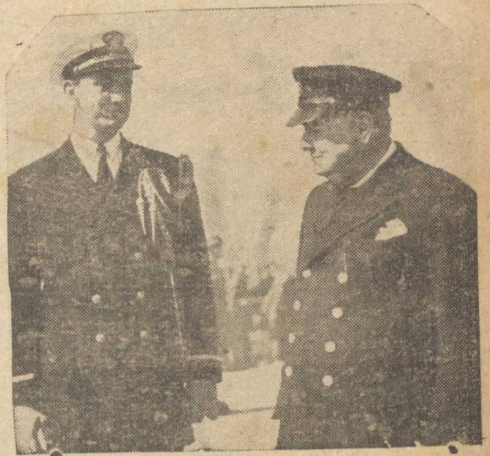
O "PREMIER" BRITÂNICO NOS ESTADOS UNIDOS — Na presente fotografia, cujo clichê nos foi enviado por via aérea da capital norte-americana, vemos o sr. Winston Churchill, chefe do governo inglês, conversando com o aspirante F. D. Roosevelt, filho do presidente dos Estados Unidos.

ladas nesta conferência, respectivas e armadas, redução ainda mais as perdas cruzadas pelo inimigo. Os países unidos nunca concordaram de forma tão atenta e pormenorizada, como hoje em dia, a respeito dos planos para ganhar a guerra. Reconhecemos em todo o