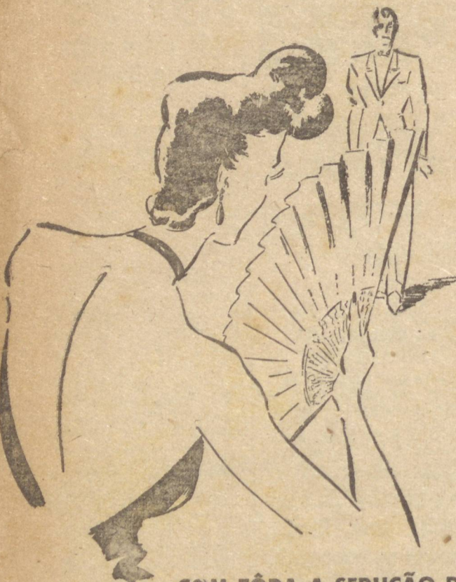
COM TÔDA A SEDUÇÃO DE