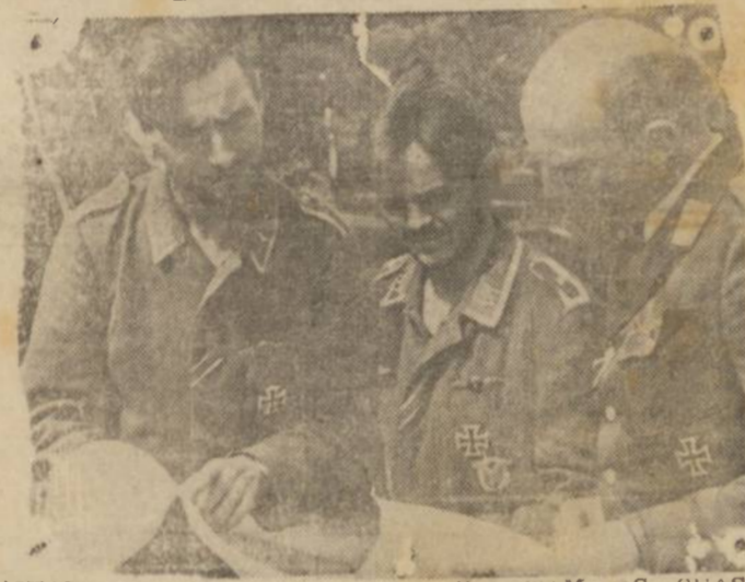
AVIADORES DA "LUFTWAFFE" RELATAM AS SUAS AVENTURAS — (Foto Transocean, pela mala aérea).

ESTOCOLMO, 24 (Reuter) — Notícias de fontes germanicas aludem á preferência das atividades aéreas. Segundo informações procedentes de Berlim, a "Luftwaffe" teria recebido retrocos para manter com o maximo vigor o ataque contra Leningrado. Outras informações consignam que o bombardeio da ilha de Gesel pela aviação germanica — o que se considera digno de reparo, por isso que o "Alton Blandet" já publicou por duas vezes telegramas de Berlim, anunciando a ocupação integral da ilha por las tropas germanicas. Os comunicados alemães registram também que os bombardeios levados a efeito contra a região de Kharkov e Ponta Grossa — ataques esses que dizem os mesmos comunicados, tem por fim evitar a concentração das tropas russas naqueles pontos. A imprensa é de que os russos concentram forças para uma resistência ativa em Leningrado.