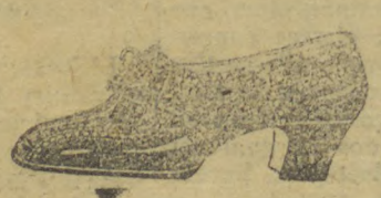
Referencia 177, modelo Napolitano — PARA O INVERNO, forma e salto mexicano, 3 e 4 centímetros de 32 a 40. Em superior naco cor de vinho, marron, rosa beje 275

Especialista em calçados finos e duraveis