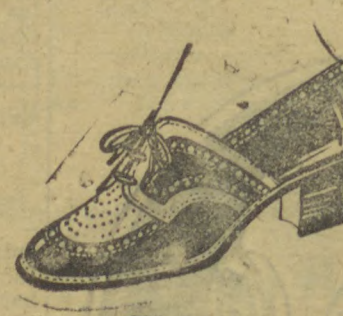
10040 — Modelo em branco e marron, gaspia toda naco marron e branco, salto 3 centímetros.

Calçado sob medida Vendas sò a dinheiro Avenida Vicente Machado 64