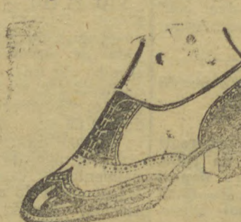
10040 — Modelo em branco e marron, gaspia toda naco marron e branco, salto 3 centímetros.