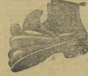
10035 — Extra phantasia em naco marron e Havana salto mexicano 3 centímetros.