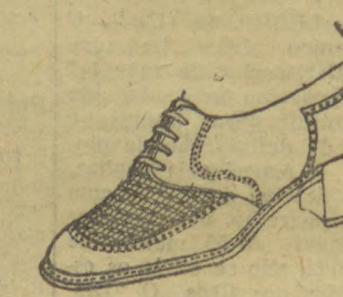
6030 — Modelo em salto mexicano, 3 centímetros, em naco beje e marron, gaspia toda trancada.