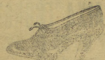
Em superior en calçado Luz XV, modo napolitano, para inverno, salto 4, 5 e 5 1/2c. Em superior pelica envernizada preta ou boscal preto ou cor de vinho, de 32 a 40 ..... 35