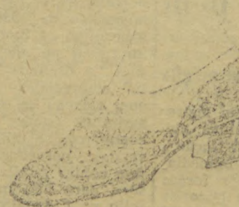
10038 — Interessante modelo em naco beje e azul, salto mexicano 3 cc. Temos este modelo em salto de sola 3 centímetros.