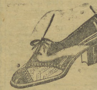
8117 — Typo esporte, muito resistente, todo em naco marron, proprio para uso diario, salto de sola 3 centímetros. Temos este typo em calçado "BOCHA"