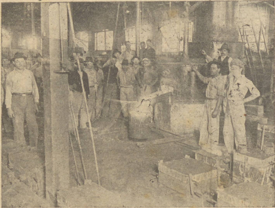
Mal pagos, os ferroviarios buscam trabalho mais com pensador, abandonando oficinas como essa, de cuja produção, entanto, a Rêde não pode prescindir.

Assim, pois, agrava-se dia a dia o dismantelo e a desorganização da R. V. P. S. C., cumprindo ao governo federal assentar energicas providencias para evitar um completo descalabro que viria ferir fundo os interesses de dois Estados.