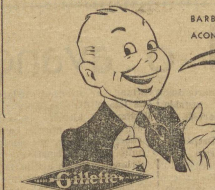
— Todos nós, alto e bom som, proclamamos: para a barba, só Gillette! Gillette e nada mais!