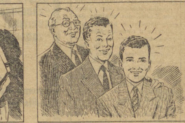
— Estás vendo como é fácil? Quando cresceres, também saberás fazer a barba em casa, não é?