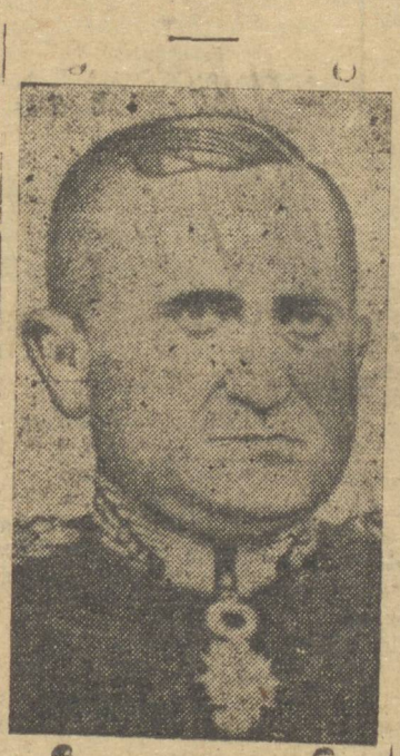
O NOME DO GAL. GASPAR DUTRA NO CARTAZ