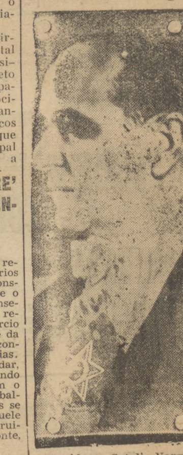
Presidente Getulio Vargas

PRAGA, 16 (D.) — Foi baixado um decreto pela chefia do Protetorado da Boêmia e Moravia, impedindo todas as reuniões esportivas no Protetorado como resultado dos lamentáveis incidentes que ocorreram durante um jogo de futebol em 8 de junho.