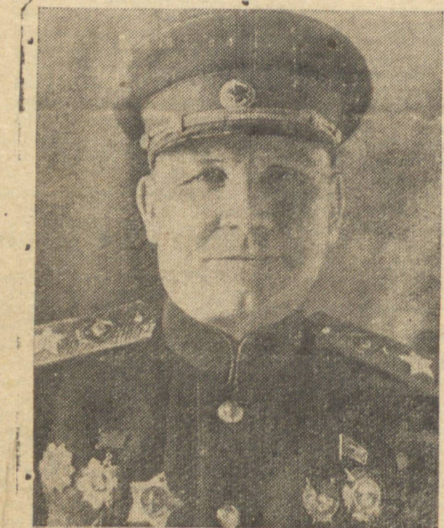
MARECHAL KONIEV, COMANDANTE DO 1.º FRONTE DO EXERCITO VERMELHO

KONIEV, QUE ERA O COMANDANTE ABSOLUTO DA CIDADE, TERÁ DE DIVIDIR AGORA O GOVERNO