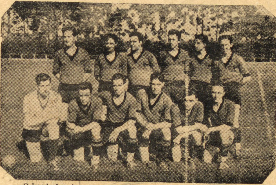
O bando bugrino, que dividiu os louros com o Olinda

ladino. x x Na partida preliminar venceram os olindenses, por 3 a zero. O juiz desse embate, sr. Kruger, embor a esforçado,