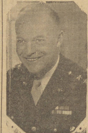
GENERAL EISENHOWER, comandante das forças aliadas na Itália

de complicadas defesas erigidas ao longo do Adriático. Esta impressão tem obtido confirmação nos despachos de países neutros, inclusive da Suíça, os quais anunciam que os nazistas minaram os principais caminhos que conduzem á Roma. Este ato, ao que se diz, constitui a previ-