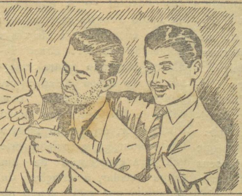
— Ficaste com água na boca? No teu caso, o que resolve é a Gillette... A aparência, meu caro, é tudo!