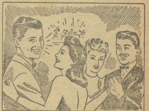
— Gillette resolve! Já vi que o namorado pagou... Ela está tendo a prova de que o meu conselho foi bom...