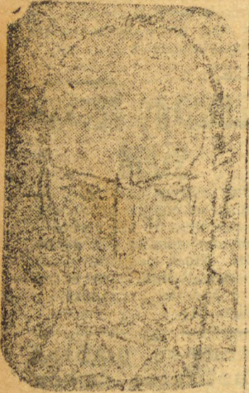
em sangue os erros do passado, da tradição e do conservantismo.