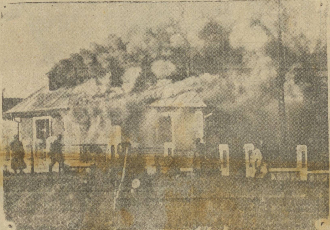
O AVANÇO ALEMÃO NA RUSSIA FRANCESA. — As hordas vermelhas incendiam as aldeias, antes de se retirar. — (Foto TRANSO CEAN, via aérea).

WASHINGTON, 11 (Reuter) — Foi noticiado nesta capital, que Lord Halifax viajara com destino a Inglaterra no próximo mês de agosto, afim de participar com os membros do Gabinete de Guerra