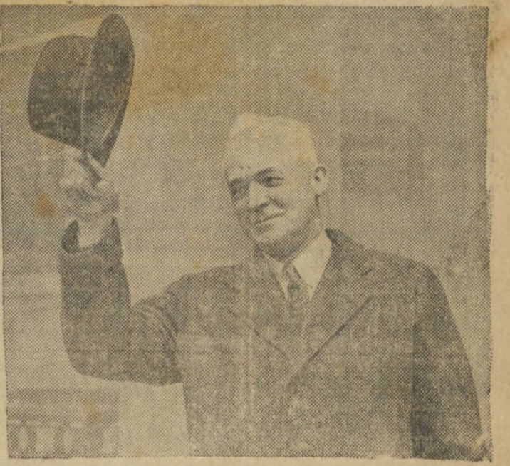
O CHEFE DA AVIAÇÃO MILITAR NORTE-AMERICANA VISITA A GRA BREITANHA. — O general Harry Arnold, chefe da Aviação Militar dos EE. UU., chegou há pouco a Inglaterra afim de inspecionar as atividades da R.A.F. A gravura que estampamos acima mostra o general Arnold agradecendo os aplausos dos londrinos, ao chegar a sede da embaixada dos Estados Unidos em Londres.

ZURICK, 11 (Stefani) — Foi anunciado que os paraquedistas russos desceram nos suburbios de Helsinki.