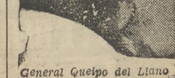
General Queipo de Llano