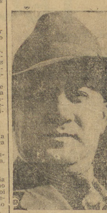
Gen. Manuel Avila Camacho

Camara dos Comuns, anunciou que além de fotografias preciosas da linha Siegfried, batidas pelos aviões ingleses a menos de 200 pés de altura, tais aparelhos conseguiram ainda descobrir inumeros aerodromos secretos das forças inimigas.