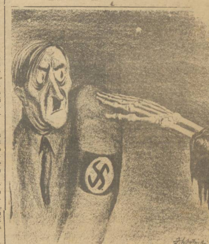
O "heii!" que Hitler prevê...

LONDRES, 19 (U. P.) — Os maiores da "Wehrmacht" foram convocados para um conselho de família, pelo chanceler Hitler, Contemporâ- do o corpo convulsionado do Terceiro "Reich", o "Fuehrer" abordou com o alto co-