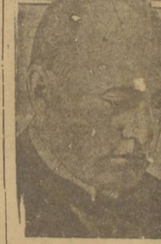
MUSSOLINI, QUANDO AINDA TINHA A FACULDADE DE PENSAR

LONDRES, 19 (U. P.) — Uma informação de Vichy anuncia que Mussolini foi in- terrompido em uma casa de saú- de, gravemente enfermo. Acrescenta-se que o ex-pri- meiro ministro italiano acha