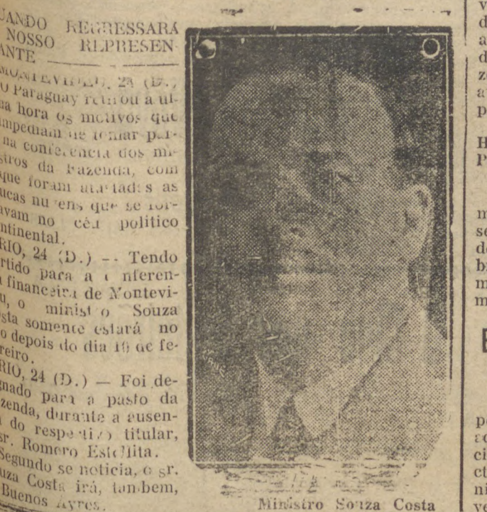
Ministro Souza Costa

Noticia-se que é para uma proxima revista do sr. Mussolini.