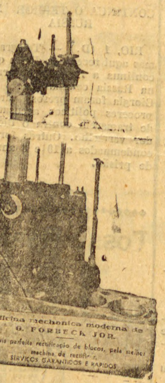
Officina mecanica moderna de H. FORBECK JOB. A mais perfeita retificação de blocos, pela melhor machina de retificação. SERVIÇOS GARRANTIDOS E RAPIDOS

Forç V.8 Retificação com pistões, pinos e aneis com peças originaes 390$ Preços somente durante os meses de Setembro a Novembro Serviços executados por pessoal com patente. H. FORBECK JOB. Rua Cél. Dulcideo n.º 90