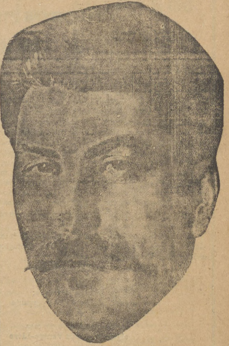
STALIN, DITADOR DE TODAS AS RUSSIAS, CULPA ATRIBUÍDA MISTERIOSAS ESTAO CAUSANDO ESTRANHESA. MORMENTE AOS GOVERNOS DOS PAISES BELIGERANTES

MOSCOU, 9 (D.) — Continuam a ser enviados reforços para a fronteira, pela possibilidade de ai se tornar, dentro em pouco, limítrofe com a Alemanha. Tambem tem sido enviada grande quantidade de materias primas para a região da fronteira polaca.