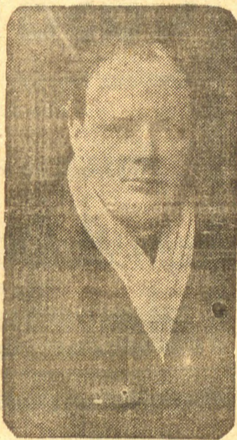
CHURCHILL GENEVRA, 29 (T. O., agência alemã)

Seis tripulantes do navio norueguês "Faro Oslo", afundado em consequência de um ataque alemão, foram trazidos a terra por um sistema de cabos. Sabe-se que mais oito membros da tripulação se recolheram num bote salva-vidas que veio a naufragar. Os trabalhos de socorro proseguiram a busca para os salvar, tendo recolhido um sobrevivente. Tres pereceram e os quatro restantes são considerados desaparecidos.