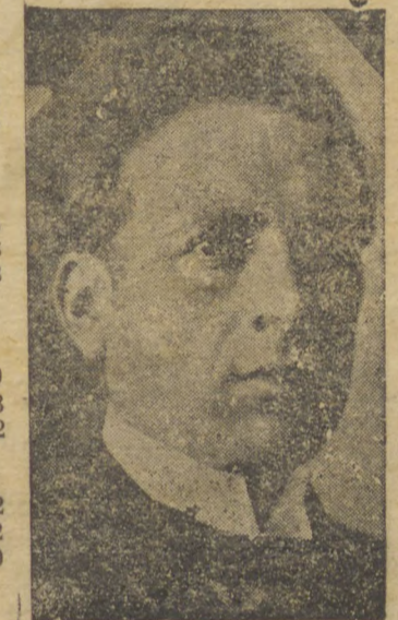
SR. FLORES DA CUNHA