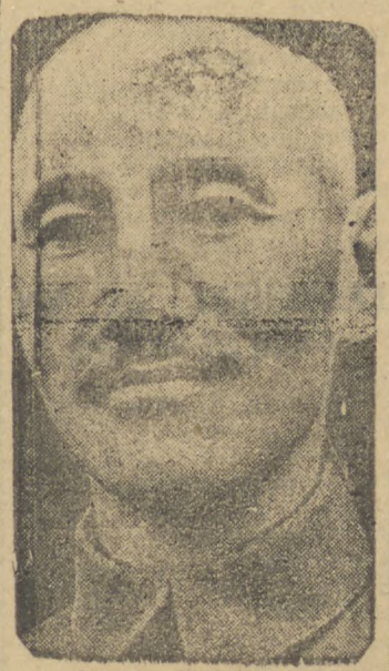
Shiang Kai Chek, generalissimo chinês

HONG KONG, 21 (U. P., agência alemã) — Anuncia-se que o exercito chinês conseguiu deter o avanço japonês, notícias que não são desmentidas pelo comando japonês.