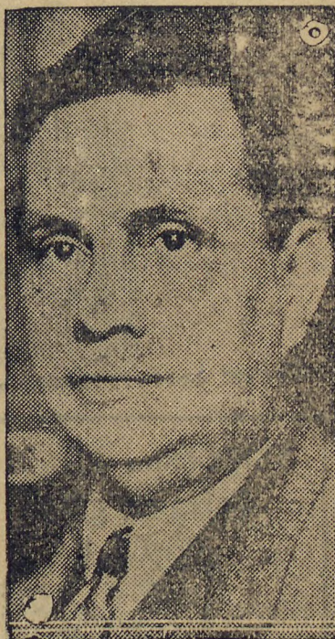
General GÓES MONTEIRO

RIO, 28 (D) — A' noite corriam varias versões pela cidade, segundo as quaes o general