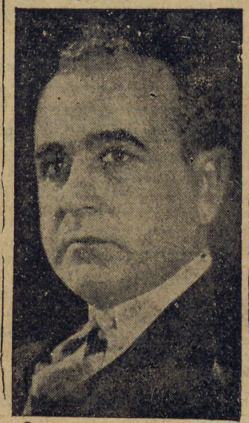
Senhor GETULIO VARGAS

RIO, 28 (D) — O sr. Getúlio Vargas, presidente da Republica, está de malas