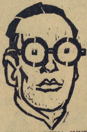
O CRIADOR DUMA INUTILIDADE...

questão até então inexistente — a questão social! Esse mesmo ministério, guardadas certas feições que lhe são proprias, até parece um ministério de Moscou... S. Paulo e a Capital Fed-