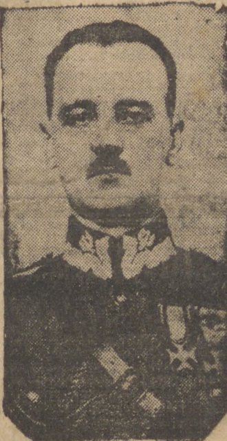
Sikorski, chefe do governo polonês na França, que enviará um representante á S. D. N.