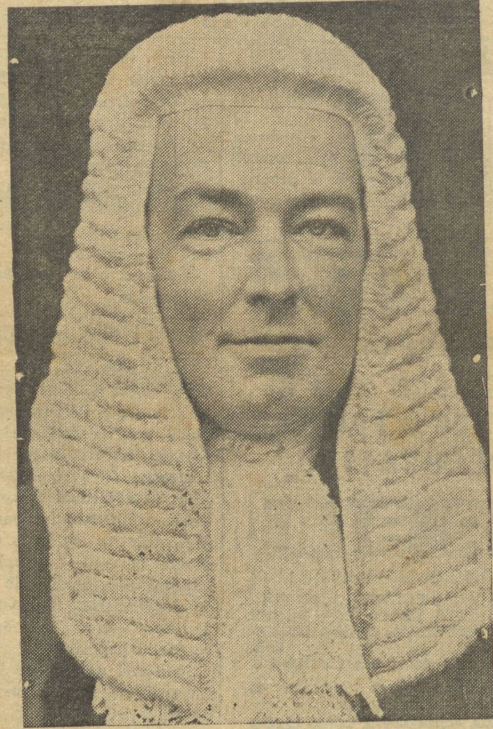
Major F. Soskie M. P., novo Solicitador Geral da Grã Bretanha.