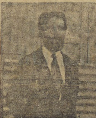
LUIZ CARLOS PRESTES

RIO, 4 (D.) — "A Nação" publica o seguinte: "Está circulando clandestinamente, largamente distribuido pelo Correio, um manifesto de Luiz Carlos Prestes sobre os ultimos