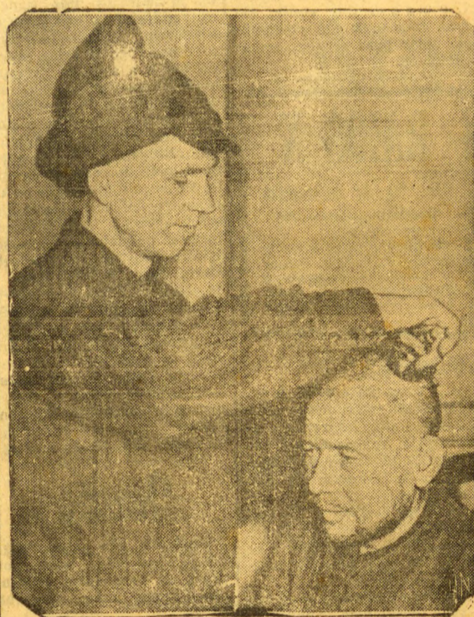
Um oficial russo, prisioneiro, faz a barba e o cabelo de um soldado finlandês.

O informante acrescenta que os finlandeses não consideram a queda de Viborg como um desastre de grandes proporções. Um grande numero de aeroplanos soviéticos de bombardeio sobrevoou hoje Helsinki, tendo o alarme anti aereo soado por duas vezes. Os finlandeses anunciam a