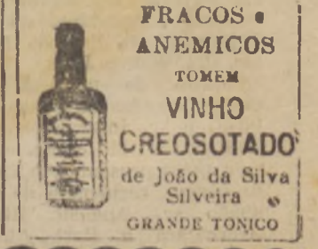
FRACOS ANEMICOS TOMEM VINHO CREOSOTADO de João da Silva Silveira GRANDE TONICO

Não percam esta oportunidade A VENCEDORA é uma só RUA 7 DE SETEMBRO N. 91. FONE 424.