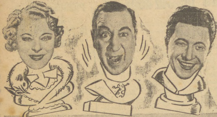
MARY BOLAND HUGH HERBERT FRANK McHUGH

O PALACIO ENCANTADO DA PRAÇA RIO BRANCO) FONE: 5-5-1)