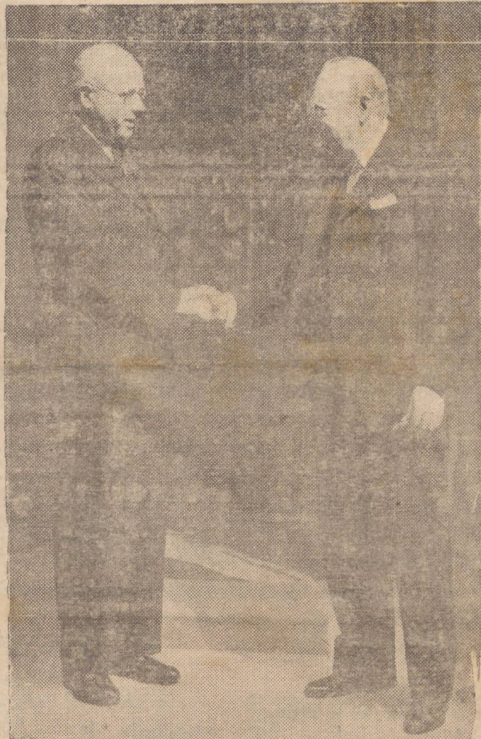
O PRIMEIRO MINISTRO, SR. WINSTON CHURCHILL DESPEDE-SE DO PRIMEIRO MINISTRO DA NOVA ZELANDIA. — O sr. Winston Churchill, primeiro ministro da Grã Bretanha, desja hoje a viagem ao Sr. Peter Fraser, primeiro ministro da Nova Zelandia, que regressa ao seu país. Ao se separarem na secretaria de Downing Street nº 10 o sr. Churchill diz: — "Atéus, que Deus vos proteja e proteja a Nova-Zelandia.

FORTALEZA, 10 (Do Correspondente Especial) — Em sessão solene, amanhã, á noite, no Teatro José de Alencar, serão entregues os diplomas da primeira turma de enfermeiras de emergencia do Curso local.