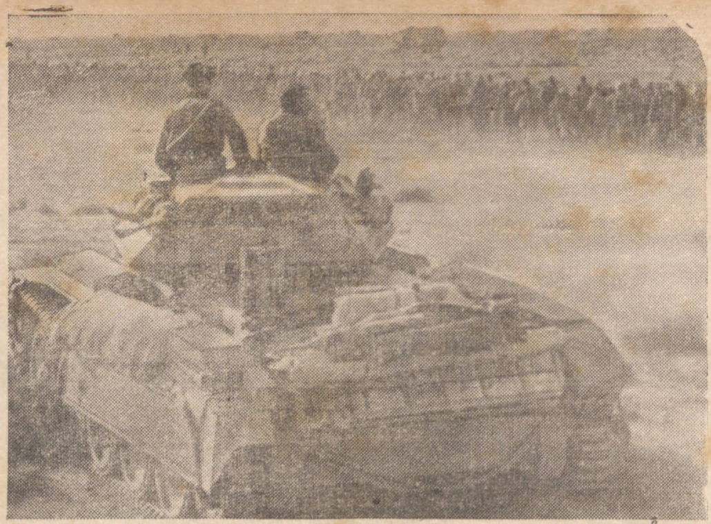
AS RETUMBANTES VITÓRIAS BRITÂNICAS NA LÍBIA — POSTOS OFICIAIS DA FRENTE DE BATALHA

A pesar da resistência oposta pelas tropas do "eixo" no momento da sua grandiosa ofensiva na Líbia, as forças britânicas, hindus e dos Domínios conseguiram rechazar todas as divisões teuto-italianas que guarneciam as posições totalitárias, obrigando-as a bater em retirada da Tripolitânia, e continuamente sob o bombardeio das esquadrilhas da RAF que perseguem sempre as forças inimigas em fuga. Vemos na gravura acima uma enorme coluna de prisioneiros do "eixo" ao serem transportados para um campo de concentração de emergência, localizado em pleno deserto, sob os olhares vigilantes da guarnição de um tank inglês.