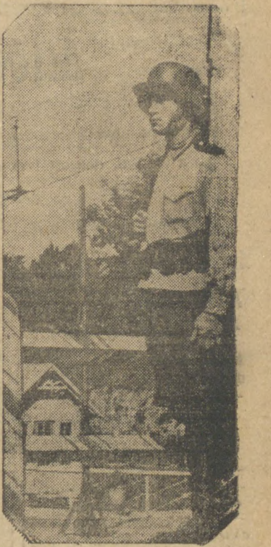
Um soldado finlandês monta guarda à entrada da cidade de Viipuri, no golfo de Finlândia, vindo de Leningrad. Este soldado é um símbolo da pequena república do Báltico, que tem se mostrado intransigente em face da Rússia. — (Serviço IN., de Nova York.)

CAIRO, 1 (S. P., agência inglesa) — O jornal "Al Missi" anuncia que será submetido a apreciação do Grão Mufti o litígio pendente entre o primeiro ministro egípcio e o rei Abdallah da Transjordânia.